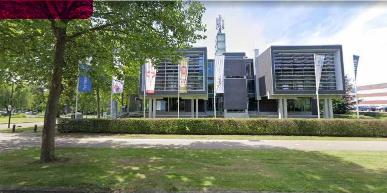
Hoofdkantoor Braden Group Heerlen